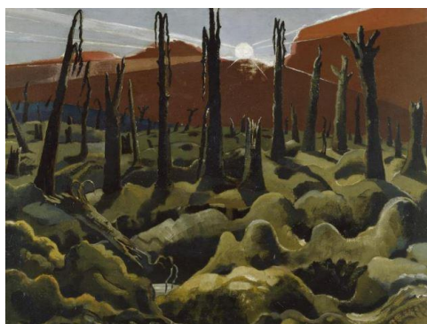
Fig. 4 P. NASH, We Are Making a New World , 1918, Imperial War Museum, London.

Se il paesaggio è una costruzione culturale complessa, individuale e sociale insieme 4 , soggetta, secondo Ceserani, a profonde trasformazioni nei momenti di crisi epocali 5 , al pari del più noto Otto Dix (Fig. 3), Nash ha colto i dirompenti cambiamenti provocati nel territorio dalla distruttività bellica e ha saputo raffigurare con straordinaria intensità il paesaggio geografico e al contempo psichico di una generazione che, sotto i colpi dei bombardamenti e dei gas, si percepì fragile e impotente sia nel chiuso delle trincee, sia negli esterni degli assalti e dei riposizionamenti, in rotta con la realtà naturale 6 . La sua pittura, dalla quale emergono gli effetti perturbanti dello shock, esemplifica la tesi di Joachim Ritter secondo il quale il paesaggio è «natura che si rivela esteticamente a chi la osserva e la contempla con sentimento» 7 .