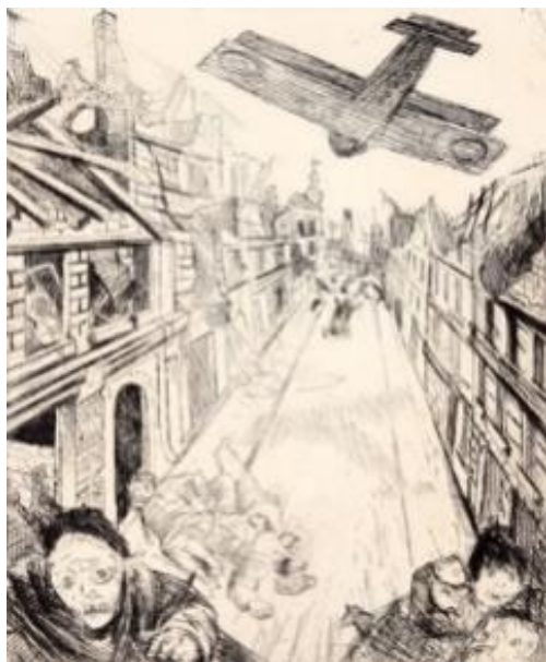
Fig. 11 O. DIX, Il bombardamento di Lens , 1924, Collezione Van de Velde, Anversa.

Di fronte a certe rappresentazioni di paesaggi terribili e seducenti, come l'euforico dipinto di Tullio Crali (Fig.10), è legittimo domandarsi cosa 'mostri' la letteratura, che si serve delle parole e di un alto tasso di figuratività per rendere memorabili le storie, visto che il suo interesse va prima di tutto allo "spazio vissuto" 13 e ai paesaggi umani, «veri e propri palinsesti [...] che recano in sé la memoria degli eventi, dei soggetti, delle storie» 14 .