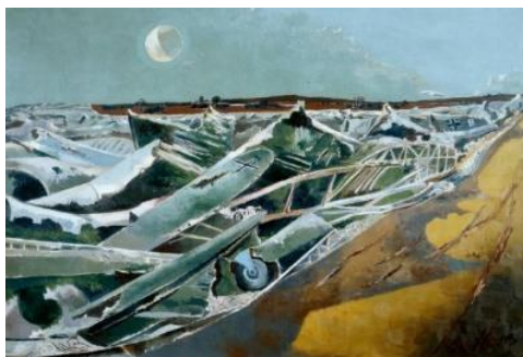
Fig. 5 P. NASH, Totes Meer (Dead Sea) , 1941, Tate Gallery, London.

In altri casi è una luna straniata a confermare la disfatta degli uomini e la metamorfosi della natura. In Totes Meer (Dead Sea) , realizzato negli anni della Seconda guerra mondiale, per esempio, Nash restituisce il movimento ondoso del mare attraverso un cimitero di lamiere ritorte, spoglie di una battaglia aerea senza sopravvissuti.