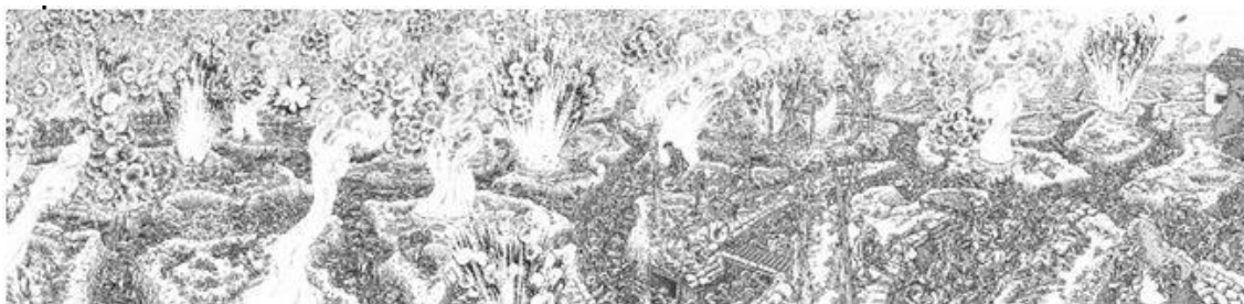
Fig. 6 J. SACCO, La Grande Guerra. 1° luglio 1916: il primo giorno della battaglia della Somme . Un'opera panoramica, Rizzoli, Milano 2013.

A differenza di Joe Sacco, che ha disegnato realisticamente le ustioni collettive del primo giorno di battaglia lungo la Somme e dei conflitti balcanici 8 , Nash scansa ogni rappresentazione naturalistica, pone in primo piano la propria percezione dei luoghi e dà prova di una potente ispirazione visionaria.