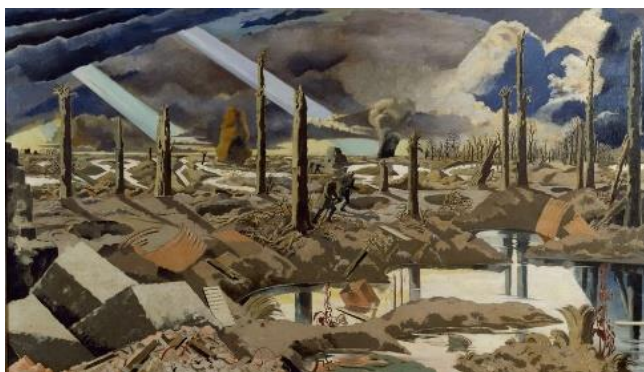
Fig. 1 P. NASH, Primavera in trincea . 1917, Imperial War Museum, London.