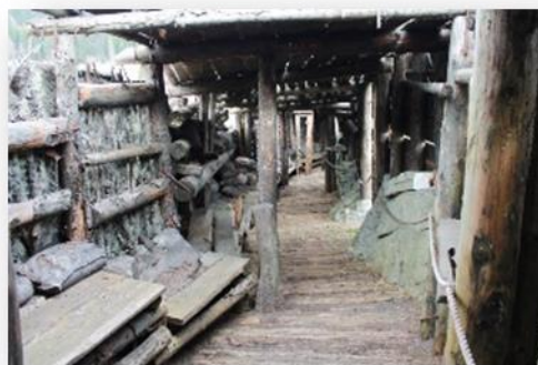
Fig. 13 Il set di Torneranno i prati , Asiago, 2016.

Non a caso nella conclusione di Torneranno i prati (2014), film non privo di sequenze liriche e di musiche struggenti 26 , liberamente ispirato a La paura , Ermanno Olmi 27 ci avverte con amarezza che dopo la guerra i prati torneranno a consolare di nuovo i vivi, ma i morti saranno dimenticati 28 .